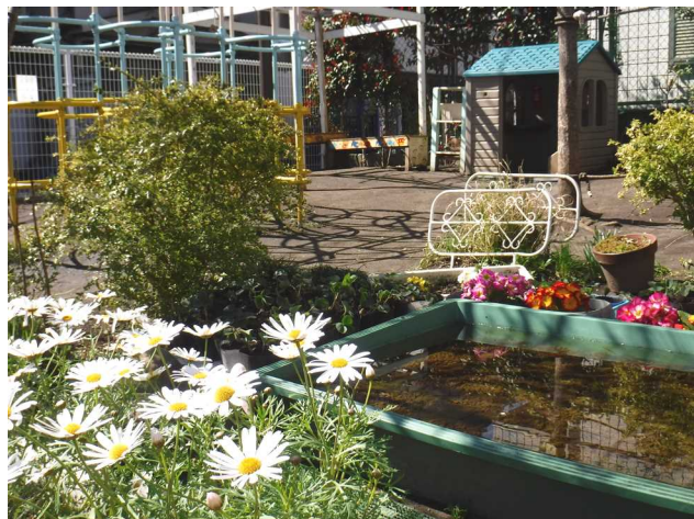
お庭の池にはメダカやエビがいます