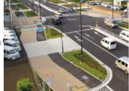
調布保谷線（西東京市）