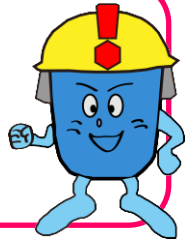
防災まちづくりマスコットキャラクター「トクン」