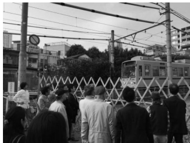
◆都市計画道路の拡幅予定地