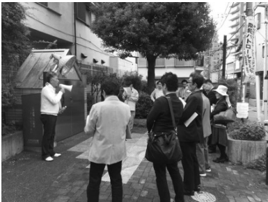
◆辻広場 (ポケットパーク)