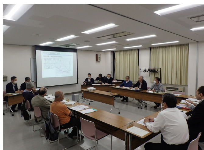
■第1回まちづくり検討会の様子