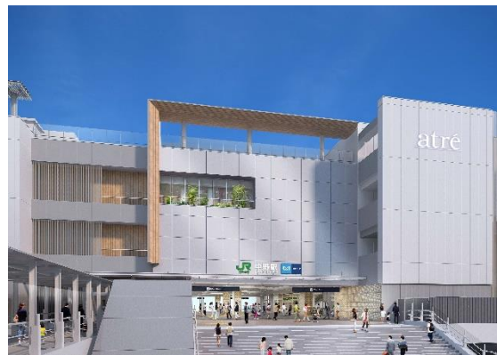
▼中野駅橋上駅舎・駅ビル 南側