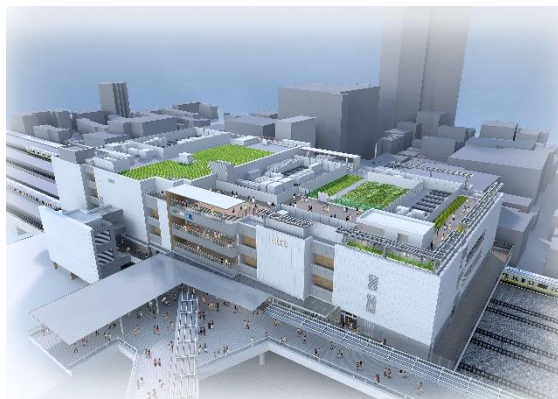
▼中野駅橋上駅舎・駅ビル 外観

中野駅西側南北通路及び橋上駅舎の整備を着実に進め、2026年12月に駅ビル、西口改札を含めて完成・開業を予定しています。ユニバーサルデザインに配慮しながら、誰もが安全で円滑に移動しやすい環境を整えるとともに、中野駅周辺の回遊性と公共交通機関の利便性を向上することで、まちのにぎわいの活性化を目指します。