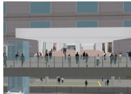
▼中野駅西側南北通路