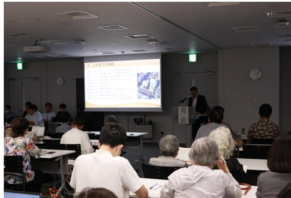
▲説明会の様子（5月28日開催）