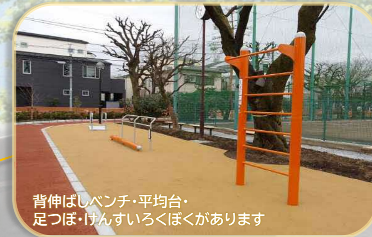
背伸ばしベンチ・平均台・ 足つぼ・けんすいろくぼくがあります