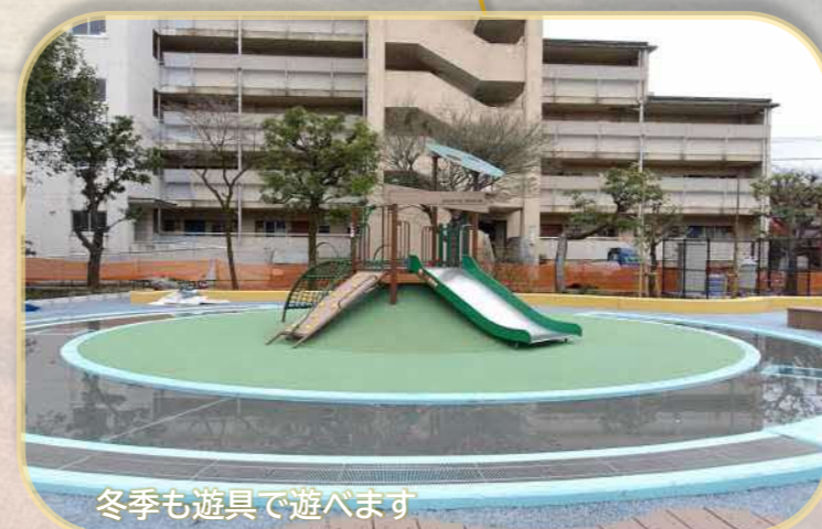
冬季も遊具で遊べます