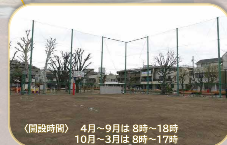
〈開設時間〉 4月～9月は8時～18時 10月～3月は8時～17時