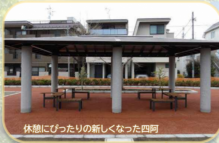
休憩にぴったりの新しかった四阿