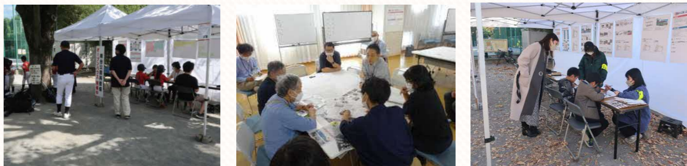
オープンハウス・ワークショップのようす

オープンハウス・ワークショップへのご協力 ありがとうございました。 みなさまのアイデアがつまった公園になりました。