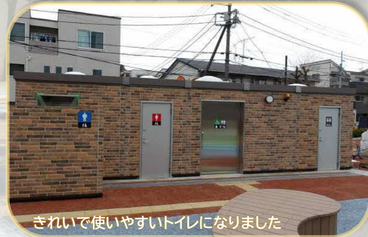
きれいで使いやすいトイレになりました