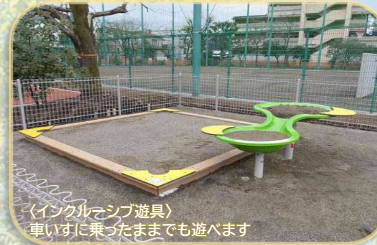
〈インクルーシブ遊具〉 車いすに乗ったままでも遊べます