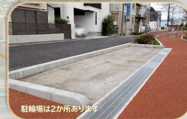
駐輪場は2か所あります