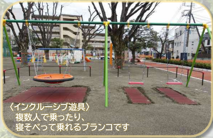
〈インクルーシブ遊具〉 複数人で乗ったり、 寝そべて乗れるブランコです