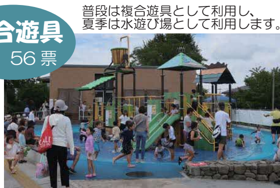
普段は複合遊具として利用し、夏季は水遊び場として利用します。