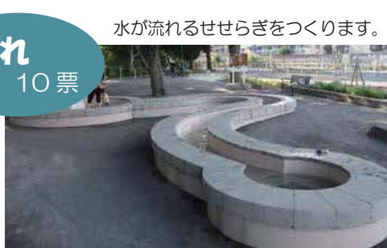
水が流れるせせらぎをつくります。