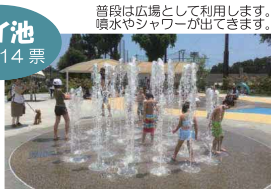
普段は広場として利用します。噴水やシャワーが出てきます。