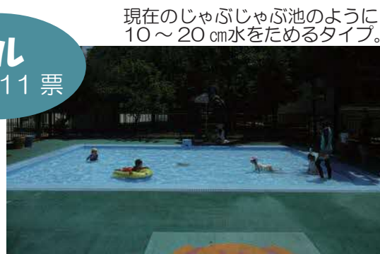
現在のじゃぶじゃぶ池のように10～20cm水をためるタイプ。