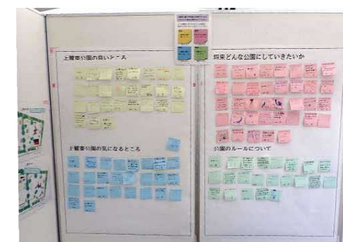
たくさんのご意見をいただきました