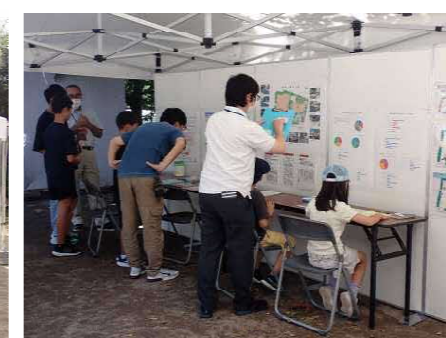
オープンハウスの様子