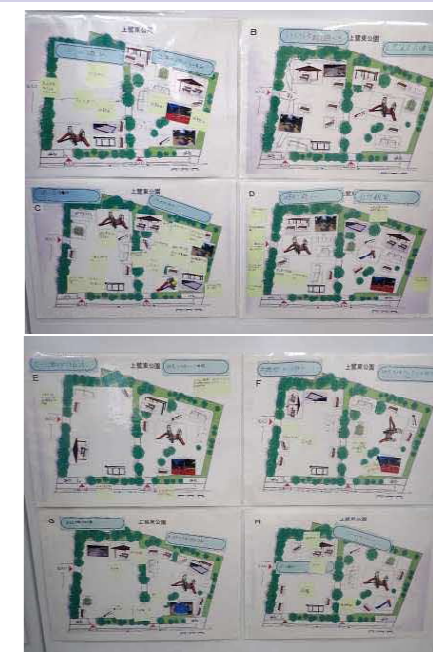
上鷲宮小学校4年生の公園プラン