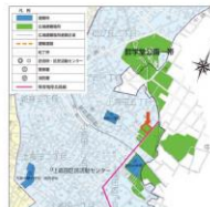
【中野区地域防災計画】