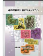
【中野区都市計画マスタープラン】