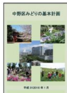
【中野区みどりの基本計画】