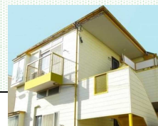
(区内セーフティネット住宅)