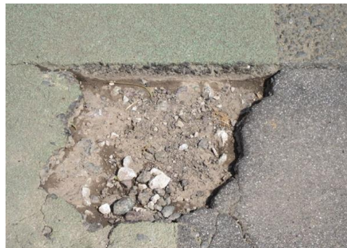
道路のアスファルトの表層が剥がれてしまう現象