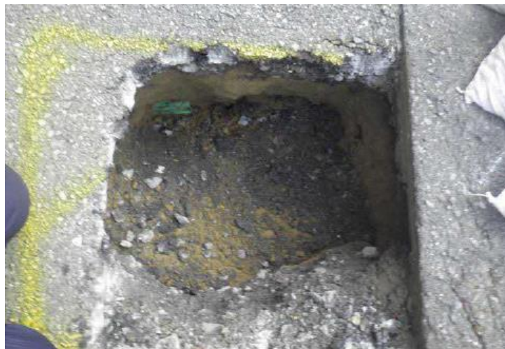
道路の表面が沈み込んで、穴になる現象