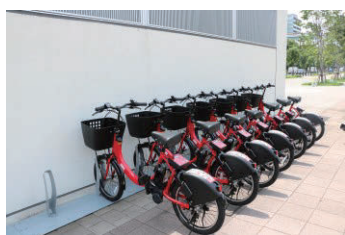
▲サイクルポートの例

区内に設置したサイクルポートで自由に自転車を借り、返すことができます。民間事業者3社と協定。利用方法や料金などは、各事業者により異なります。