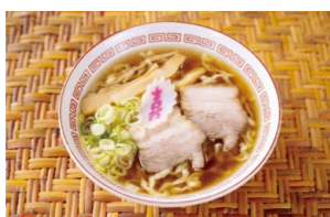
▲名物の喜多方ラーメン

蔵のまち、喜多方ラーメンでおなじみ。名水が育む日本酒や「そばの郷」の風味豊かなそばも有名です