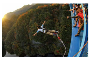
▲電神大吊橋のバンジージャンプが有名