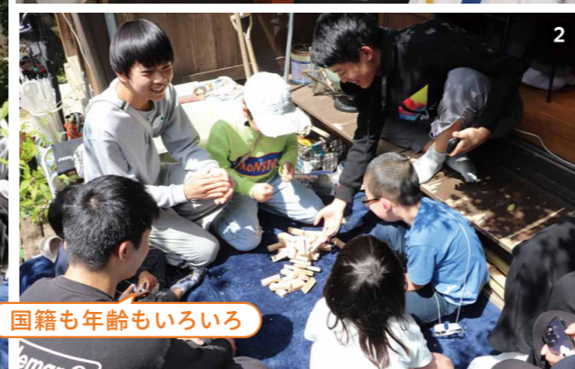
国籍も年齢もいろいろ