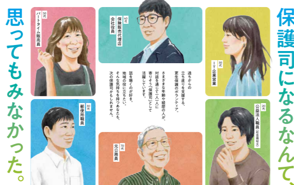
犯罪や非行を防止し、立ち直りを支える地域のチカラ 第76回 社会を明るくする運動 主催：区庁 協賛：更生保護