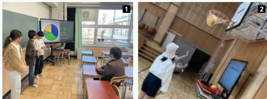
1 プレゼンの様子、2 新しい用具を使う児童たち

児童が校長先生に企画を提案し、バスケットボール、メジャー、フープなど体育用具を購入。授業の幅が広がり、より楽しく体育学習に取り組めるようになりました。