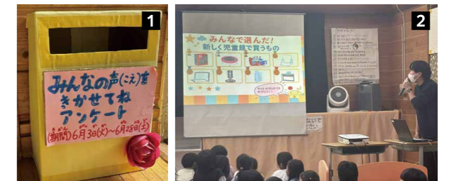
1 児童館に設置しているアンケートボックス 2 アンケート結果発表会の様子