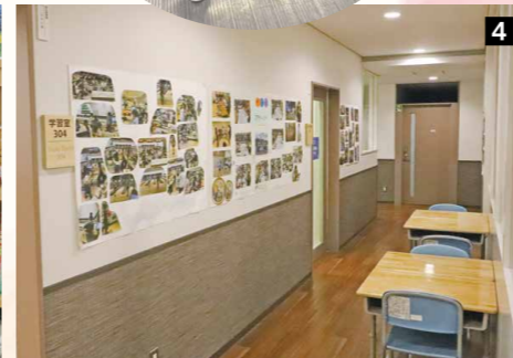
1 ボッチャや卓球などができる運動スペース、2 楽器演奏に挑戦する様子 3 小説や漫画なども充実。中野東図書館も併設しているため、自分のペースで学びや読書に取り組めます、4 廊下には体験活動の写りが飾られています