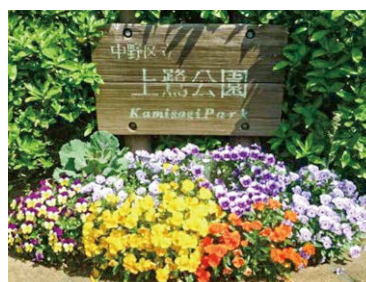
◀昨年度の「地域緑化活動部門」受賞写真