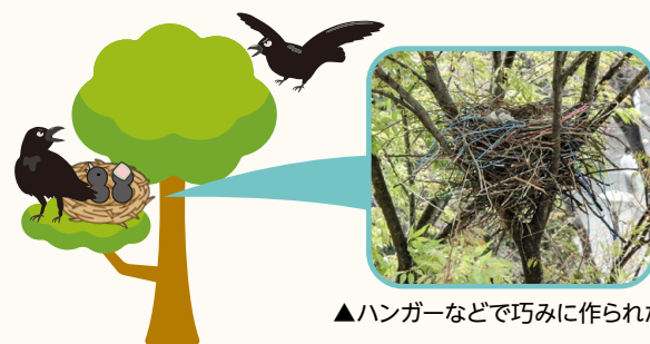
▲ハンガーなどで巧みに作られた巣

カラスは、3月～6月ごろに繁殖期を迎えます。卵やヒナを守ろうとして警戒心が強まるため、人を攻撃することがあります。カラスの習性を知り、寄せ付けない対策を取りましょう。