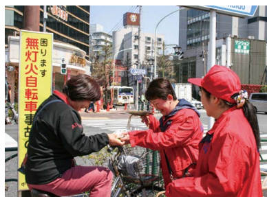
▲特殊詐欺防止の呼び掛け