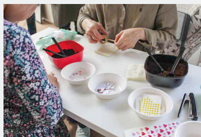
▲サステナブルな取り組みとして「オリジナル脱臭剤」も作成しました

SDGsを子どもにも親しみやすく伝え、身近な行動につなげることを目的にワークショップを開催。コーヒーを題材に事業環境やフェアトレードなどを学び、SDGsにつながる行動を「やってみる」「続ける」ことの大切さを考えるきっかけとなりました。