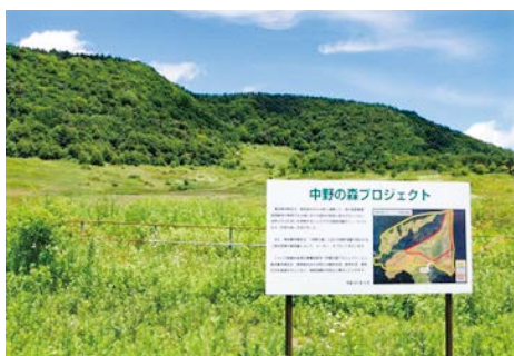
▲協定により群馬県みなかみ町に設けた「中野の森」(15ha)。福島県喜多方市とも協定を締結し、森林を整備しています

任意の寄付金額を上乗せした商品やサービスを提供する商店・団体を募集。寄付金額の合計が2万円以上の場合にはヒノキで作った感謝状を贈呈し、区HPに掲載