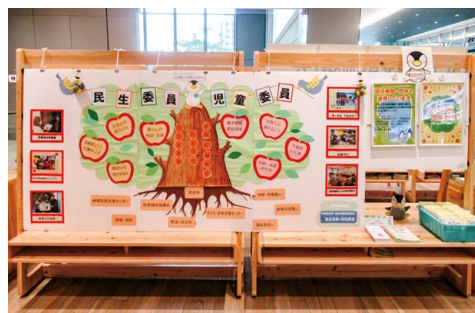
▲過去のパネル展の様子