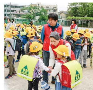
▲小学生の登下校を見守り