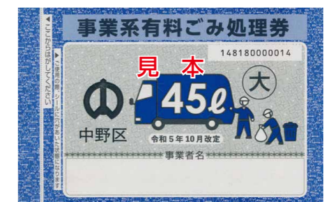
▲中野区事業系有料ごみ処理券