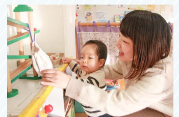
▲子育てひろばの様子

子育てひろばや児童館でのんびり過 したり、月齢の近いお友達同士で遊 んだりできます。乳幼児親子向け講座 やイベントも実施