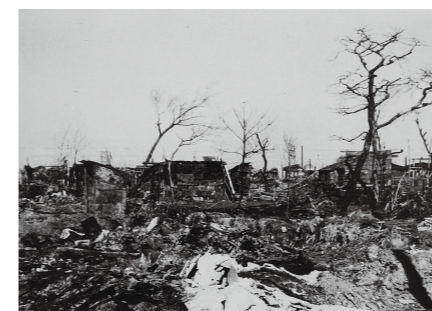
▲空襲で焼け野原と化した新井薬師付近(昭和20年5月)

②5月25日(土)～6月6日(木)午前8時30分～午後5時(最終日は2時まで)=上鷲宮区民活動センター(上鷲宮3-7-6)