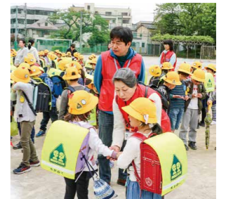
▲小学生の登下校を見守り