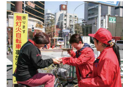
▲特殊詐欺防止の呼び掛け