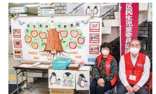
▲過去のパネル展の様子