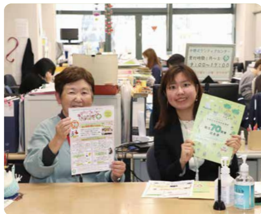
▲ボラセン窓口の様子