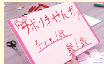
▲白熱した編集会議