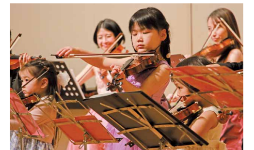
▲昨年度の助成事業「みんなで楽しくクラシック」