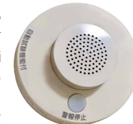
▲警報器は、電池切れなどがないか定期的に確認を

☆区役所や消防署の職員が、訪問販売を行うことはありません。悪質な訪問販売にはご注意ください