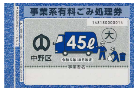
▲中野区事業系有料ごみ処理券

なお、粗大ごみの収集には、申し込みが必要です。区HPから手続きするか、電話で、粗大ごみ受付センター☎(5715)2255(月~土曜日の午前8時~午後7時)へ。