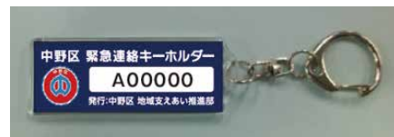
▲「緊急連絡キーホルダー」

対象 おおむね70歳以上の一人暮らし や日中は一人で家に居るなど、必要と する高齢者世帯