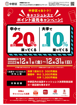
▲キャンペーンポスター