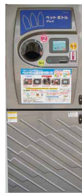
▲ペットボトル自動回収機