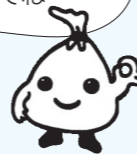
▲中野区ごみ減量キャラクター「ごみのん」