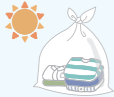
▲古着・古布は必ず晴れた日に出してください

☆古着・古布はリサイクル展示室でも回収。回収日・実施地域などについて詳しくは、 区HP をご覧ください