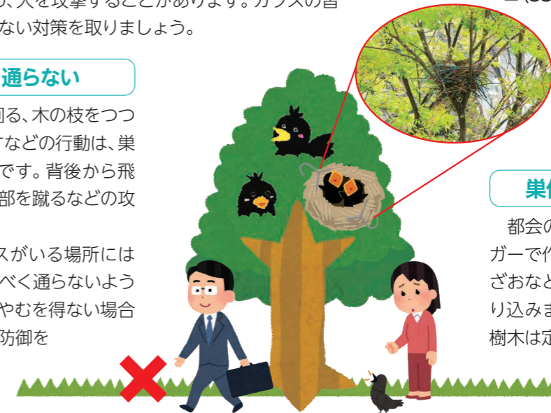
◀ハンガーなどで巧みに作られた巣

そのようなカラスがいる場所には巣があります。なるべく通らないようにしましょう。☆やむを得ない場合は、帽子や傘などで防御を