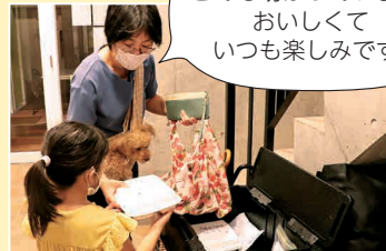
テイクアウトだけの利用もできます