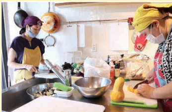
栄養バランスの良い料理を手作り。上高田2丁目で毎週月曜日に開催