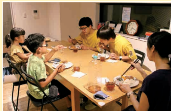
芸人さんと一緒に夕食。保護者のお迎えを待つ間も笑いが絶えません