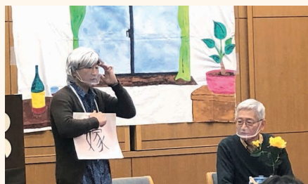
▲講座で熱演するMIKANメンバー。寸劇で分かりやすいと評判

MIKANでは、団体同士の情報交換を通じたネットワークづくりに取り組んでいます。また、寸劇仕立てで楽しく学べる「認知症サポーター養成講座」を出前で実施。参加者同士の交流も生まれています。こうした横のつながりを広げながら、認知症になっても安心して暮らせるまちにしていきたいです。