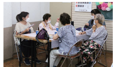
▲「おしゃべりカフェ」の様子

介護従事者や家族会など地域の方が運営して います。コーヒーやお茶を飲みながら、参加者同 士の交流や情報交換ができる憩いの場です。