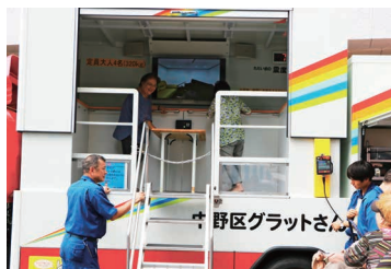
▲起震車で震度7の揺れを体験。非常食などの展示もあります