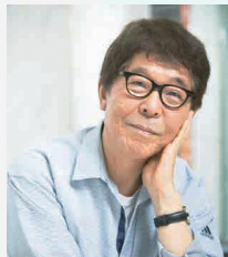
▲講師の末井昭氏(作家)

対象 区内在住・在勤の方 日時 9月13日(火)午後7時～9時 会場 区役所7階会議室 申込み 8月12日～9月6日に電話、☑hoke nyobo@city.tokyo-nakano.lg.jp、ファクスまたは郵送で、精神保健支援係(〒164-0001中野2-17-4)へ。先着50人。要約筆記・ 手・保 (先着5人)希望の方は、あわせて申し込みを。☑住所、氏名とふりがな、電話番号、要約筆記・ 手 はその旨、 保 はお子さんの氏名とふりがな、月年齢