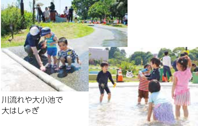
川流れや大小池で 大はしゃぎ

就学前のお子さんは、保護者の同伴が必要です。 ☆9月30日まで開放。実施時間は午前10時～午後4時30分