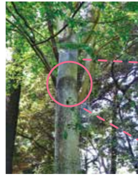
ビオトープ池の横に生育 するアオギリ

所在地 江古田3-14 アクセス 関東バス「江古田の森」すぐ ☆公園利用は午前6時~午後11時