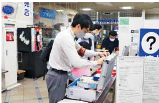
投票用紙の枚数を確認して、出発