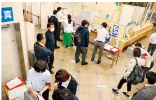
区内40か所の投票所担当者が区役所に集合