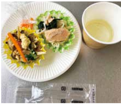
▲妊婦さんにおすすめの料理を試食