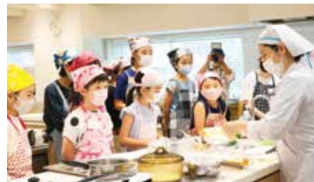
▲過去の様子。今回は、料理は持ち帰ります