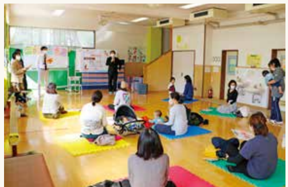
▲過去の開催の様子