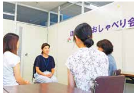
▲不妊治療経験のあるピアカウンセラーを交えたおしゃべり会

申込み 6月21日～7月8日に電子申請か、電話または直接、子ども医療助成係へ ☆両方への参加も可