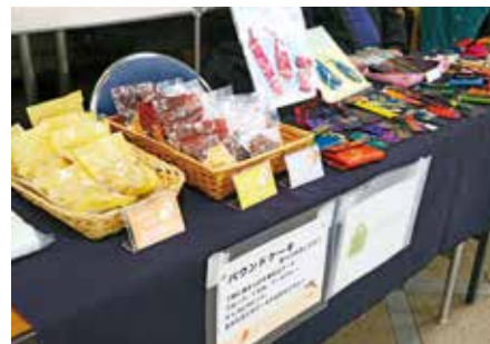
▲心を込めて作った品が並びます