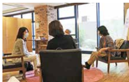
▲「寄り添いカフェ」の様子