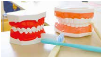
▲歯の模型を使った歯磨き指導も

申込み 3月22日～4月14日に電話、ファクスまたは直接、鷺宮すこやか福祉センターへ。先着4人。☑住所、氏名とふりがな、年齢、電話番号、ファクス番号、お子さんと参加する場合はお子さんの年齢