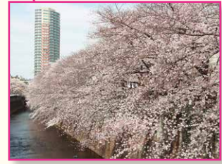
神田川四季の道 (JR中央線の北側～小滝橋)