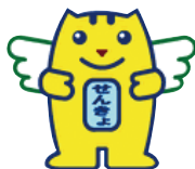
▲明るい選挙イメージ キャラクター 「選挙のめいすいくん」