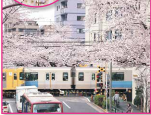
中野通り (中野駅～哲学堂公園)