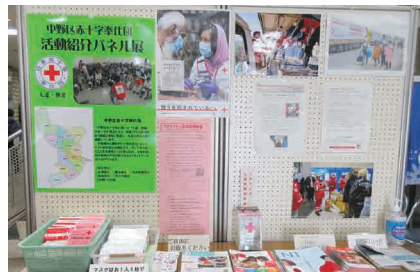
▲過去のパネル展の様子