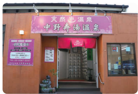
区内唯一の天然温泉(8)中野寿湯温泉