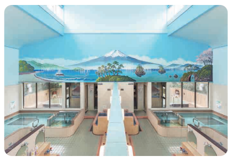
銭湯絵師によるペンキ絵が壮観(14)高砂湯