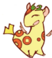
▲個人住民税PRキャラクター「ぜいきりん」