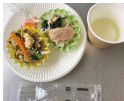
▲妊婦さんにおすすめの料理を試食

日程 2月15日(水) 会場 南部すこやか福祉センター 申込期間 2月1日～13日