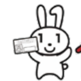
▲マイナンバーキャラクター「マイナちゃん」