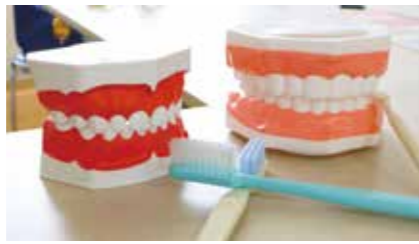
▲歯の模型を使った歯磨き指導も