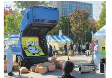
▲大人気の清掃車積み込み実演

午前9時40分と午後1時に参加券を配布。中野四季の都市を水素で走るバスで1周します。