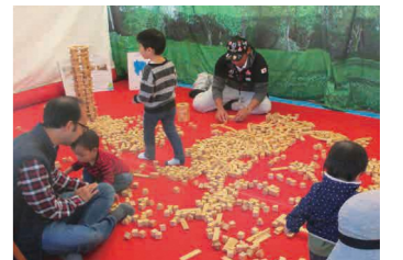
▲小さなお子さんも楽しめます

家庭で使い切れない未利用の食品をお持ちください。☆対象食品の条件は区HPで確認を