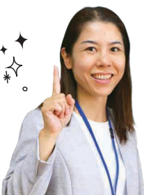
◀児童相談所設置調整係長