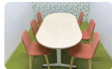
緑を基調とした相談室▶

用途に応じた17の相談室を用意。相談する方の年齢や気持ちの状態に合わせた部屋で、安心して悩みを相談できます。