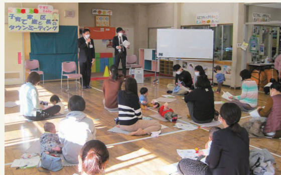
▲過去の開催の様子

☆お子さんと一緒に参加可。当日直接会場へ。先着20人程度。午前10時～10時20分には、図書館職員による絵本の読み聞かせもあります