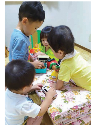
▲家庭的保育の様子