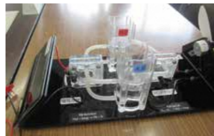
▲お子さんの自由研究にも