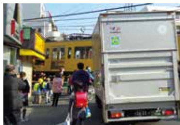
▲踏切待ちの現状(野方駅)

申込み 6月21日～7月14日の平日に電子メールか、電話またはファクスで、野方以西まちづくり係へ。各日先着30人。要約筆記・ 手 ・ 保 (各日先着3人)希望の方は、各開催日の7日前までの平日にあわせて申し込みを。☑住所、氏名とふりがな、参加希望日、要約筆記・ 手 はその旨、 保 はお子さんの氏名とふりがな、月年齢