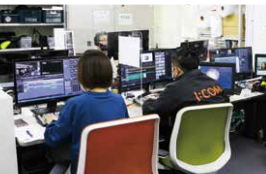
▲編集室。収録したての情報をタイムリーにお届け