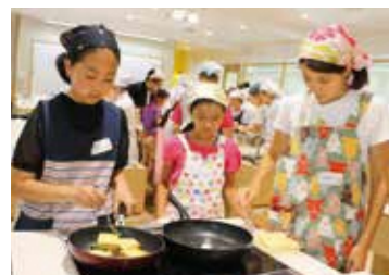
▲過去の様子。今回は、料理は持ち帰ります

申込み 6月21日午前9時～7月20日に電話またはファクスで、ごみ減量推進係へ。各日先着12組。☑住所、参加者2人の氏名とふりがな、学年(在学の方は学校名も)、電話番号、メールアドレス、参加希望日