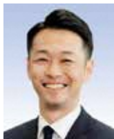
同副議長 酒井たくや