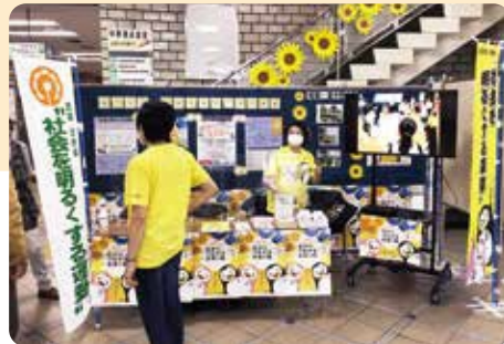
▲「#生きづらさを、生きていく。」が今年のテーマ。地域の理解が、立ち直りを支えます

犯罪や非行をなくすためには、立ち直ろうと決意した人を社会で受け入れていくことが必要です。7月は「再犯防止啓発月間」でもあります。立ち直りを支える地域・家庭づくりを進めるために何ができるかを考えてみませんか。