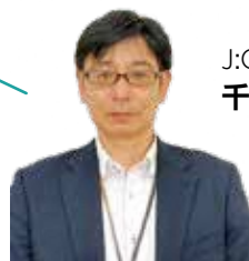
J:COM 中野 千葉局長

J:COM 中野は、区と協定を結び、災害発生時などに災害・防災情報や行政情報を提供しています。その他、防災無線の配信や字幕放送による地域情報の提供、区議会定例会の放送なども。ぜひ、ご覧ください。