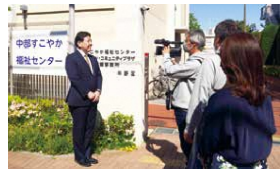
▲区長自ら中野を紹介

地元をよく知っている方にも「あの店のオーナーはこんなに面白い人だったんだ」など、これまで知られていなかった一面を発見してもらえるような番組にしたいです。他のメディアでは取り上げないことに着目し、同じ話題でも角度を変えて紹介をするといった工夫をしています。