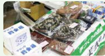
▲売り上げの一部は犯罪被害者支援団体の活動に助成しています